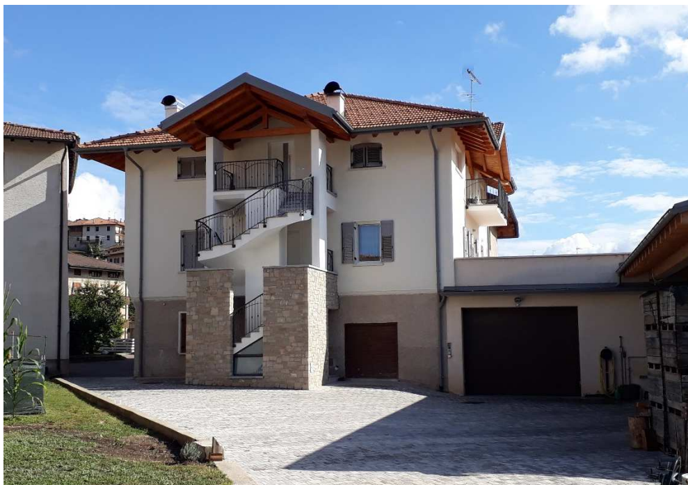
Vista da nord