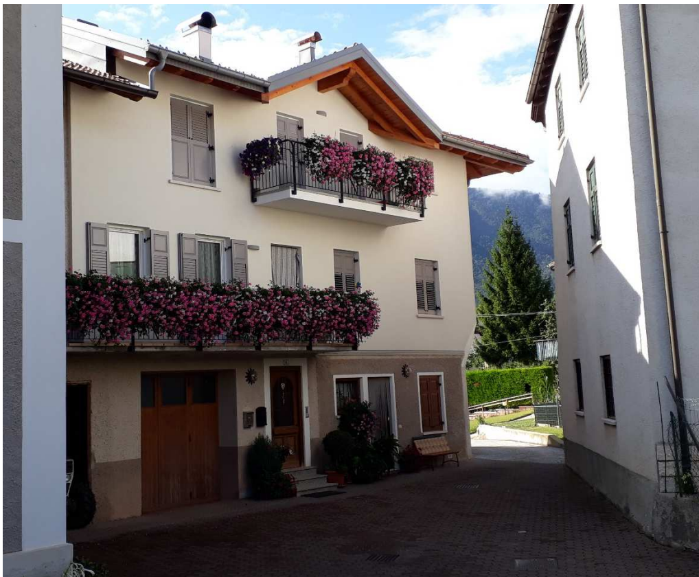
Vista da sud